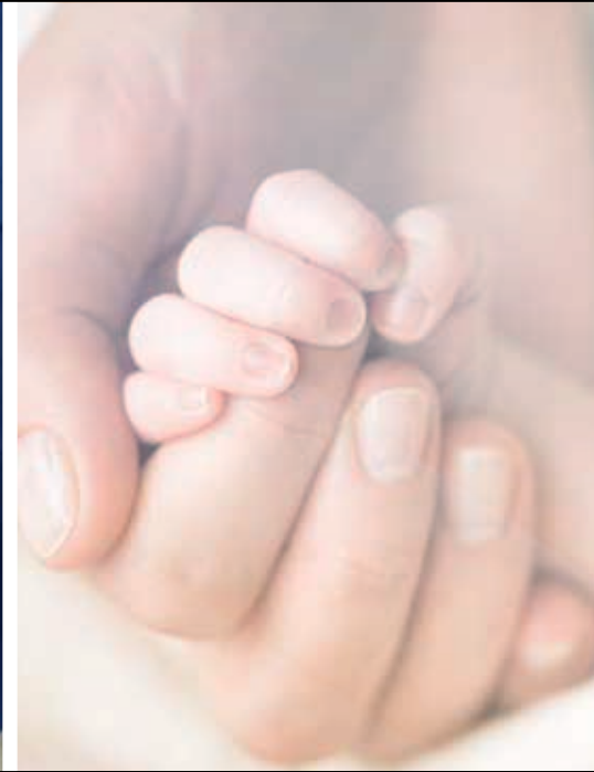
Infezioni nel bambino